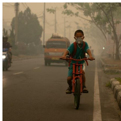
Efekty smogu wpływające na jakość życia mieszkańców

Przygotowując swoje rozwiązanie użyjcie wszystkich technologii, jakie są dostępne. Czy może to być telefon komórkowy + aparat? A może lepiej użyć sensora pyłu? A może po prostu potrzeba lepszej komunikacji z ludźmi, którzy żyją w miejscach, gdzie częściej smog występuje?