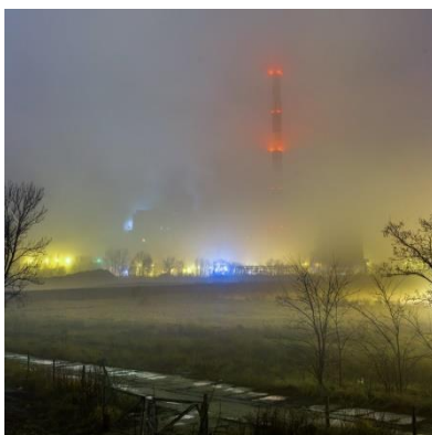
Smog w pobliżu fabryki